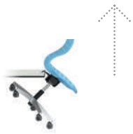
PantoMove-LuPo Silla con base de estrella