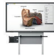
MediaPilon GF 1.0 con pantalla VS-S-C montaje de pared, regulable en altura