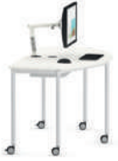
Shift+ Base Mesa semicircular