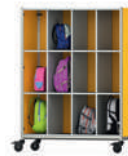
Serie 600 Espacio de almacenam- iento móvil