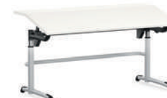
Ergo-III Mesa patín, regulación continua de altura mediante manivela