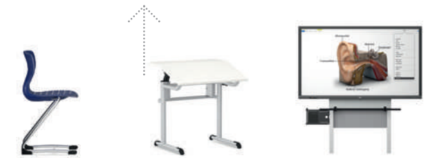
PantoSwing-LuPo silla voladiza con flexión hacia adelante