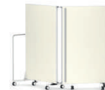
Serie 2000-P bombio, elemento individual