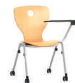
Compass-VF Silla de cuatro patas, apilable