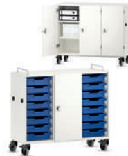
Shift+ Landscape Estanterías móviles con gavetas de plástico Gratnells