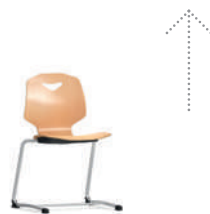
JUMPER Ply Active Silla voladiza hacia adelante