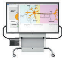
MediaBasic GF 1.0 con pantalla VS-S-C, móvil, regulable en altura