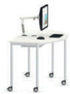
Shift+ Base Mesa semicircular