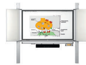
MediaPilon GG 1.4 con pantalla VS-S-C montaje de pared, regulable en altura