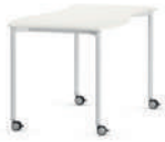
Shift+ Base Mesa de grupos