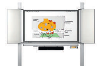
MediaPilon GG 1.4 mit con pantalla VS-S-C montaje de pared, regulable en altura