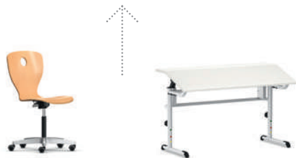
PantoMove-VF Silla con base de estrella