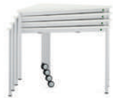
TriTable-III Apilable mesa triangular