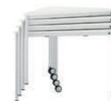
TriTable-III Apilable mesa triangular