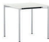
Cross-R Mesa individual