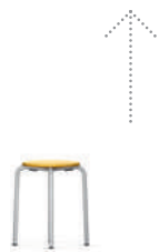
Rondo Taburete de cuatro patas