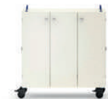
Shift+ Landscape Armario con puertas para sala especializada, móvil