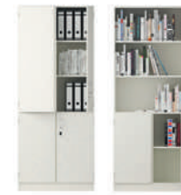
Serie 800 Armarios combinados