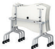
Shift+ Base Mesa de grupos, plegable