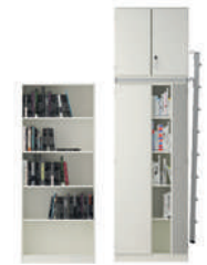
Serie 800 Estanterías y estanterías superiores con escalera de armario