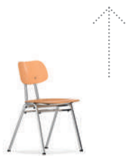
KN-39 Silla de cuatro patas