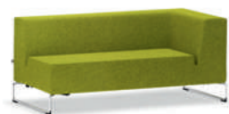
Serie Lounge Elemento tapizado LowBack