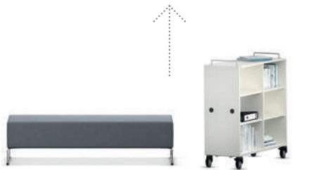
Serie Lounge Elemento tapizado LowBack

Naturalmente, estos muebles son tan robustos y fáciles de limpiar como lo requiere su uso en centros escolares. Pero eso no se tiene que ver a primera vista Serie Lounge.