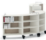
Shift+ Landscape Estanterías móviles