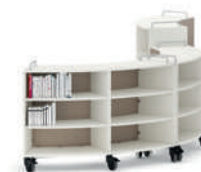
Shift+ Landscape Esteras móviles