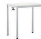
EcoTable-Q Mesa individual