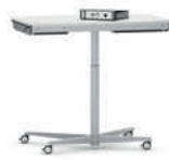
RondoLift-R Teach Mesa regulable en altura para sentarse o estar de pie