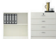
Serie 800 Estanterías y cajoneras