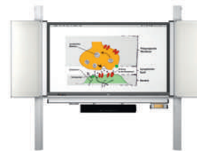
MediaPilon GG 1.4 con pantalla VS-S-C, montaje de pared y regulable en altura