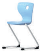
PantoSwing-LuPo voladizo con flexión hacia adelante

Los módulos de asiento Shift+ Landscape y las estanterías móviles son ideales para organizar estancias. Se pueden combinar de múltiples maneras y las estanterías se pueden unir fácilmente mediante imanes. Lo práctico de esta combinación es que los grupos de aprendizaje siempre tienen a mano su espacio de almacenamiento.