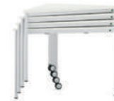
TriTable-III Apilable mesa triangular