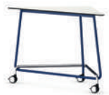
TriUnion Mesa alta