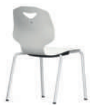
JUMPER Ply Four Silla de cuatro patas