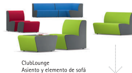
ClubLounge Asiento y elemento de sofá

Los segmentos circulares Serie Lounge HiBack pueden utilizarse para crear una isla de asiento y relajación, visual y acústicamente protegida del ambiente por los respaldos elevados.