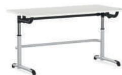
Ergo-I Mesa deslizante, ajuste de altura continuo mediante manivela