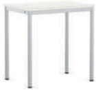
EcoTable-R Mesa de cuatro patas