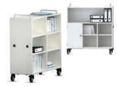
Shift+ Landscape Estanterías móviles