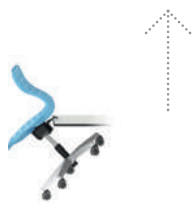
PantoMove-LuPo Silla con base de estrella