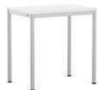
EcoTable-R Mesa individual