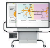
MediaBasic GF 1.0 con pantalla VS-S-C, móvil, regulable en altura