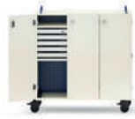
Shift+ Landscape Armario con puertas para sala especializada, móvil