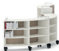
Shift+ Landscape Estanterías móviles