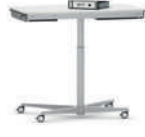
RondoLift-R Teach Mesa regulable en altura para sentarse o estar de pie