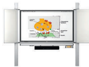
MediaPilon GG 1.4 con pantalla VS-S-C montaje de pared, regulable en altura