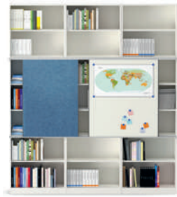
Serie 800 Estanterías con FlexiPanel