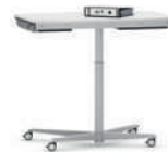
RondoLift-R Teach Mesa regulable en altura para sentarse o estar de pie