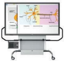
MediaBasic GF 1.0 con pantalla VS-S-C, móvil, regulable en altura