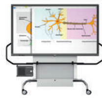
MediaBasic GF 1.0 con pantalla VS-S-C, móvil, regulable en altura