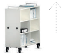
Shift+ Landscape Esteras tapizadas y alfombras (FloorFriends)