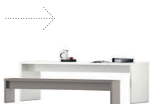
MTable MBench Mesa lateral Banco lateral