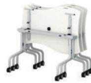
Shift+ Base Mesa de grupos, plegable