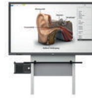
MediaPilon GF 1.0 con pantalla VS-S-C montaje de pared, regulable en altura