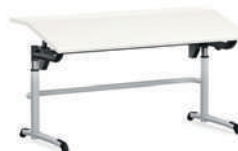
Ergo-III Mesa patín Ergo-III, regulable en altura de forma continua mediante manivela