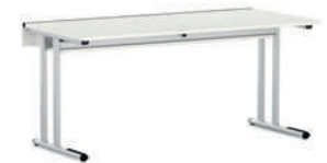
Duo-Media Mesa de ordenador