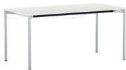
Cross-R Mesa de cuatro patas