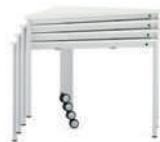
TriTable-III Apilable mesa triangular