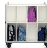
Shift+ Landscape Armario para guardar zapatos, móvil