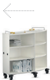
Shift+ Landscape Esteras tapizadas y alfombras (FloorFriends)