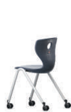
Compass-LuPo con ruedas