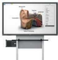
MediaPilon GF 1.0 con pantalla VS-S-C montaje de pared, regulable en altura