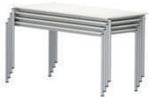
LiteTable-AL Mesa ligera apilable