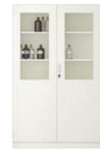
Serie 800 Armarios de colección y especializados