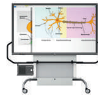
MediaCenter GF 1.0 con pantalla VS-S-C, móvil, regulable en altura