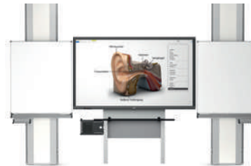
TopPilon-VI con MediaPilon GF 1.0 con pantalla VS-S-C Multi-Touch, montaje en pared, regulable en altura