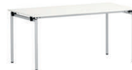
Clapp-4R Mesa plegable