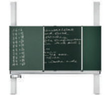
TopPilon-V Pizarra de pilones con cinco superficies de escritura