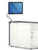
MediaBox Puesto de trabajo de medios del profesor con espacio de almacenamiento