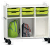
Shift+ Landscape Estanterías móviles con gavetas de plástico Gratnells