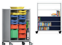
Serie 600 Módulos de almacenamiento con gavetas de plástico Gratnells