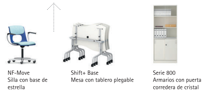
NF-Move Silla con base de estrella

Igual de móvil: Las sillas de base de estrella NF-Move y PantoMove-VF de altura regulable sin escalonamientos y con ruedas.