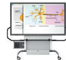
MediaCenter GF 1.0 con pantalla VS-S-C, móvil, regulable en altura