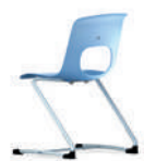
NF-Swing voladizo con flexión hacia adelante