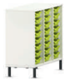
Shift+ Landscape Estanterías móviles con gavetas de plástico Gratnells