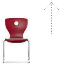
PantoSwing-LuPo voladizo con flexión hacia adelante