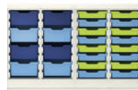
Serie 800 Semiarmarios y estanterías con gavetas de plástico Gratnells