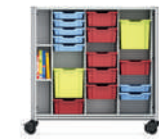
Serie 600 Módulo de almacenamiento