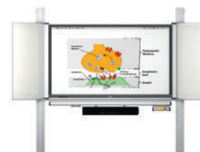
MediaPilon GG 1.4 con pantalla VS-S-C montaje de pared, regulable en altura