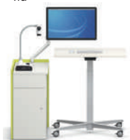
MediaBox Puesto de trabajo de medios del profesor con espacio de almacenamiento