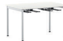
EuroLine-K Mesa de cuatro patas