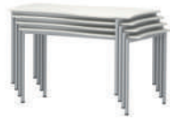
Shift+ Base Mesa de grupos, plegable