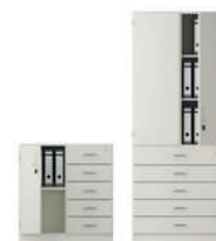
Serie 800 Armarios combinados y de cajones