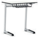
Uno-C Mesa patín