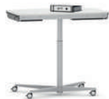
RondoLift-R Teach Mesa regulable en altura para sentarse o estar de pie