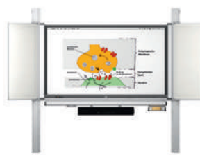
MediaPilon GG 1.4 con pantalla VS-S-C montaje de pared, regulable en altura