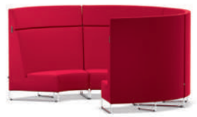
Serie Lounge Elemento tapizado HiBack