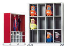
Serie 600 Espacio de almacenamiento móvil