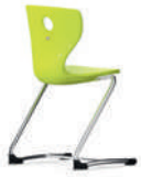
PantoSwing-LuPo voladizo con flexión hacia adelante