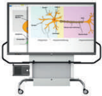
MediaBasic GF 1.0 con pantalla VS-S-C, móvil, regulable en altura