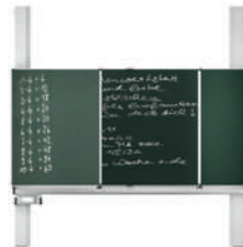
TopPilon-V Pizarra de pilones con cinco superficies de escritura