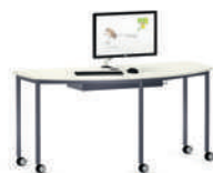
Shift+ Base Mesa semicircular