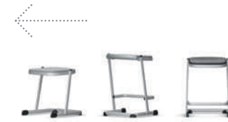
LuPoStool Taburete de patín