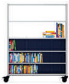
Serie 600 Módulo de almacenamiento