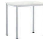
EcoTable-R Mesa individual