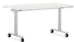
FlipTable-TF Mesa individual