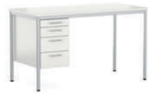
EcoTable-R Mesa de profesor