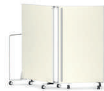
Serie 2000-P Biombo