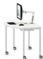
Shift+ Base Mesa semicircular