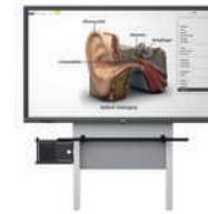
MediaPilon GF 1.0 con pantalla VS-S-C montaje de pared, regulable en altura