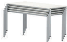
LiteTable-AL Mesa ligera apilable