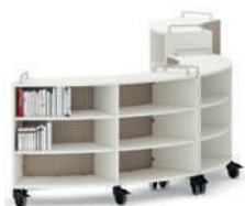
Shift+ Landscape Esteras móviles