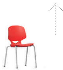
JUMPER Air Four Silla de cuatro patas