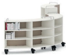
Shift+ Landscape Estanterías móviles