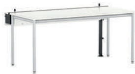
NetWork-Media Media Mesa de ordenador