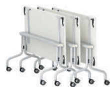
FlipTable-RU Mesa con tablero plegable