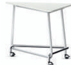
TriUnion Mesa alta