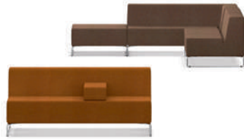
Serie Lounge Elemento tapizado LowBack