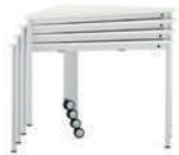
TriTable-III Apilable mesa triangular