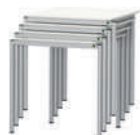
LiteTable-ST Mesa ligera apilable