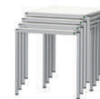
LiteTable-ST Mesa ligera apilable