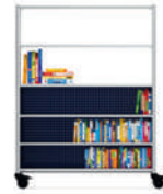
Serie 600 Módulo de almacenamiento