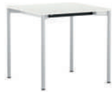
Cross-R Mesa individual