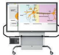
MediaBasic GF 1.0 con pantalla VS-S-C, móvil, regulable en altura