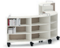
Shift+ Landscape Esteras móviles