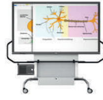
MediaBasic GF 1.0 con pantalla VS-S-C, móvil, regulable en altura