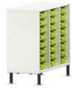
Shift+ Landscape Estanterías móviles con gavetas de plástico Gratnells