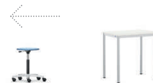
Rondo Taburete con base de estrella

Los elementos de armario móviles Shift+ Landscape proporcionan espacio de almacenamiento directamente donde se está trabajando. El raíl con tableros MediaPro-II ofrece una superficie versátil de trabajo y presentación.